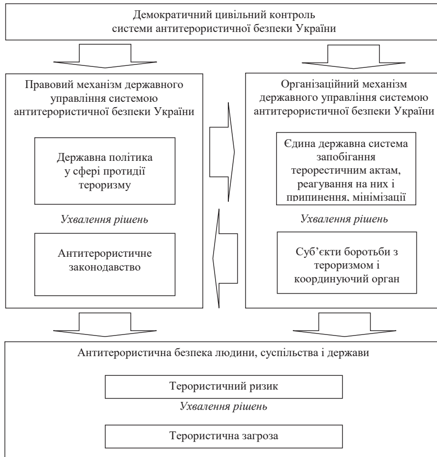
Рис. 1. Структурна схема функціонування механізмів державного управління системою антитерористичної безпеки України

державного управління); нормативну частину (сукупність принципів, норми та правила, що призначені для виконання управління); інструментальну (управлінські рішення, перелік повноважень, засоби впливу на об'єкт управління); технологічну (технологічна основа організації ухвалення рішення в органі управління) [11; 4]. У дослідженні [4] також додано ще інформаційно-аналітичну частину (містить інформаційні аспекти процесу управління й аналізує впровадження рішень). погоджуємося із цією пропозицією та розділимо її на дві складові частини: інформаційну (містить інформаційні аспекти процесу управління) і аналітичну (аналізує впровадження управлінських рішень).